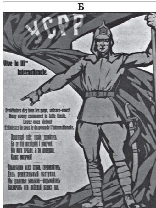
Пролетарі всіх країн з'єднайтесь! Бо це бій останній і рішучий. Ми його зачали, а ти доверши. Клас могутий!