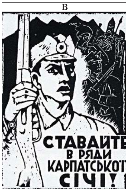
Ставайте в ряди Карпатської Січі!