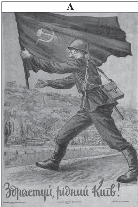
Здрастуй, рідний Киє!

27. Установіть послідовність створення агітаційних плакатів.