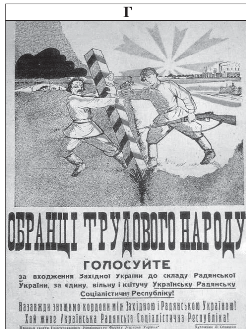
Обранці трудового народу! Голосуйте за входження Західної України до складу Радянської України, за єдину, вільну і квітучу Українську Радянську Соціалістичну Республіку!